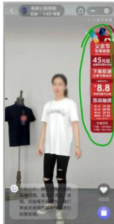
直播前置图片示例